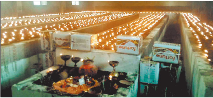
प्रज्वलित अखण्ड मनोकामना दीप।