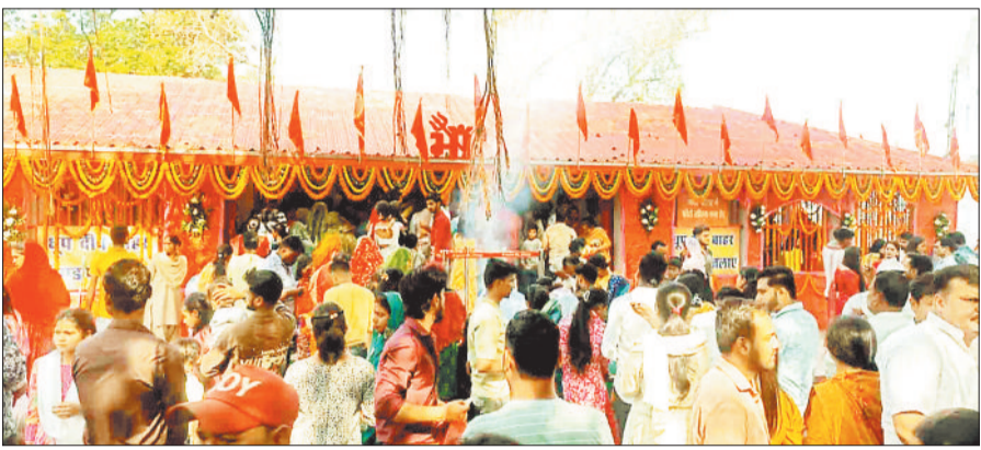
महामाया मंदिर में पूजा-अर्चना करने उमड़ी श्रद्धालुओं की भीड़।

हिन्दू नववर्ष व चैत्र नवरात्रि के पहले दिन शहर के महामाया मंदिर, दुर्गा शक्ति पीठ, साइबर बेरियर स्थित वन देवी मंदिर, रामेश्वर मंदिर सहित अन्य शक्ति पीठों व मंदिरों में श्रद्धालुओं का हुजूम उमड़ा। श्रद्धालु गुरुवार की तड़के से ही पूजा अर्चना करने के लिए मंदिर पहुंचने लगे। श्रद्धालु मंदिरों में विधिवत पूजा अर्चना करने के बाद भक्तों द्वारा कलश प्रज्वलित किए गए। यह अखण्ड ज्योति पूरे नौ दिनों तक अनवरत जलती रहेगी। सुबह आरती उपरांत देवी मंदिर के पट श्रद्धालुओं के लिए खोल दिया गया था। श्रद्धालु कतार लगाकर पूरे दिन देवी की आराधना करते रहे। श्रद्धालुओं की भीड़ को देखते हुए मंदिर परिसर में बड़ी संख्या में पुलिस बल एवं यातायात को नियंत्रित करने यातायात कर्मियों