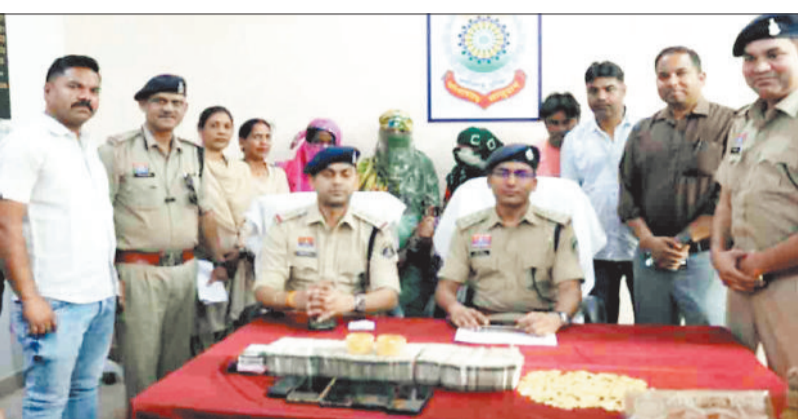
मामले की खुलासा करते सीएसपी, जब्त रूपए व आरोपी।