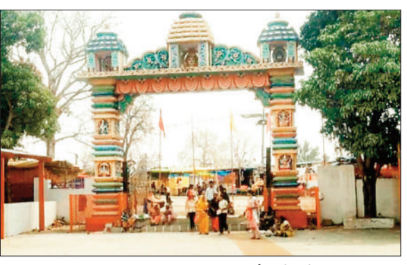
हरिभूमि न्यूज >>> बैकुण्ठपुर